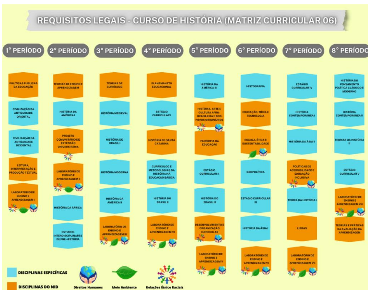
Figura 1: Requisitos Legais na Matriz Curricular do Curso

No curso de História, a organização curricular, conforme ilustra a figura abaixo, fundamenta-se nos princípios do Currículo Conectado da IES e contempla a flexibilidade necessária ao atendimento de todos os componentes curriculares no percurso de formação do futuro profissional. A figura Formação Profissional do Curso de História demonstra a o movimento da formação proposta.