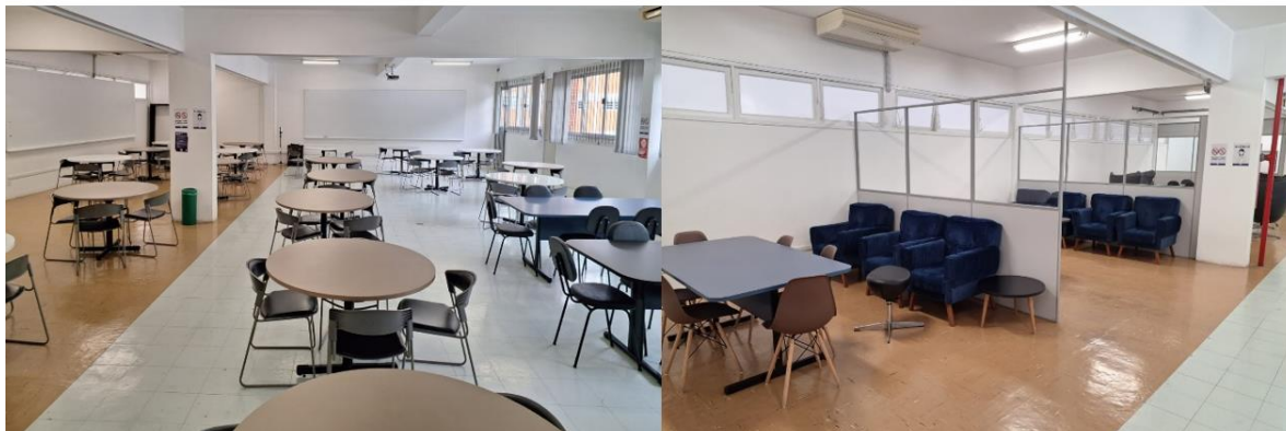
Figura 2 Espaço do Conhecimento Compartilhado – Campus Professor Edison Villela (Itajaí) – Setor F4

antena wifi, 6 condicionadores de ar, quantidade de tomadas correspondente à capacidade de ocupação e banheiros feminino e masculino.