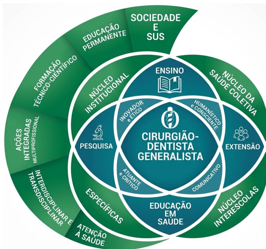
Figura 1: Movimento da formação proposta no Curso de Odontologia