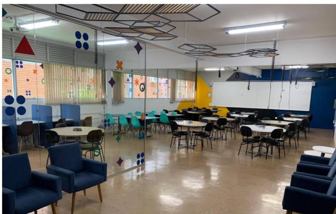
Figura 4 Espaço do Conhecimento Compartilhado – Campus Professor Edison Villela (Itajaí) – Setor B6

O espaço é composto por 4 mesas retangulares (com 6 cadeiras cada), 10 mesas redondas (com 4 cadeiras cada), 6 áreas de estudo individual, 2 lousas, 2 projetores multimídia, 1 antena wifi, 2 condicionadores de ar e quantidade de tomadas correspondente à capacidade de ocupação.